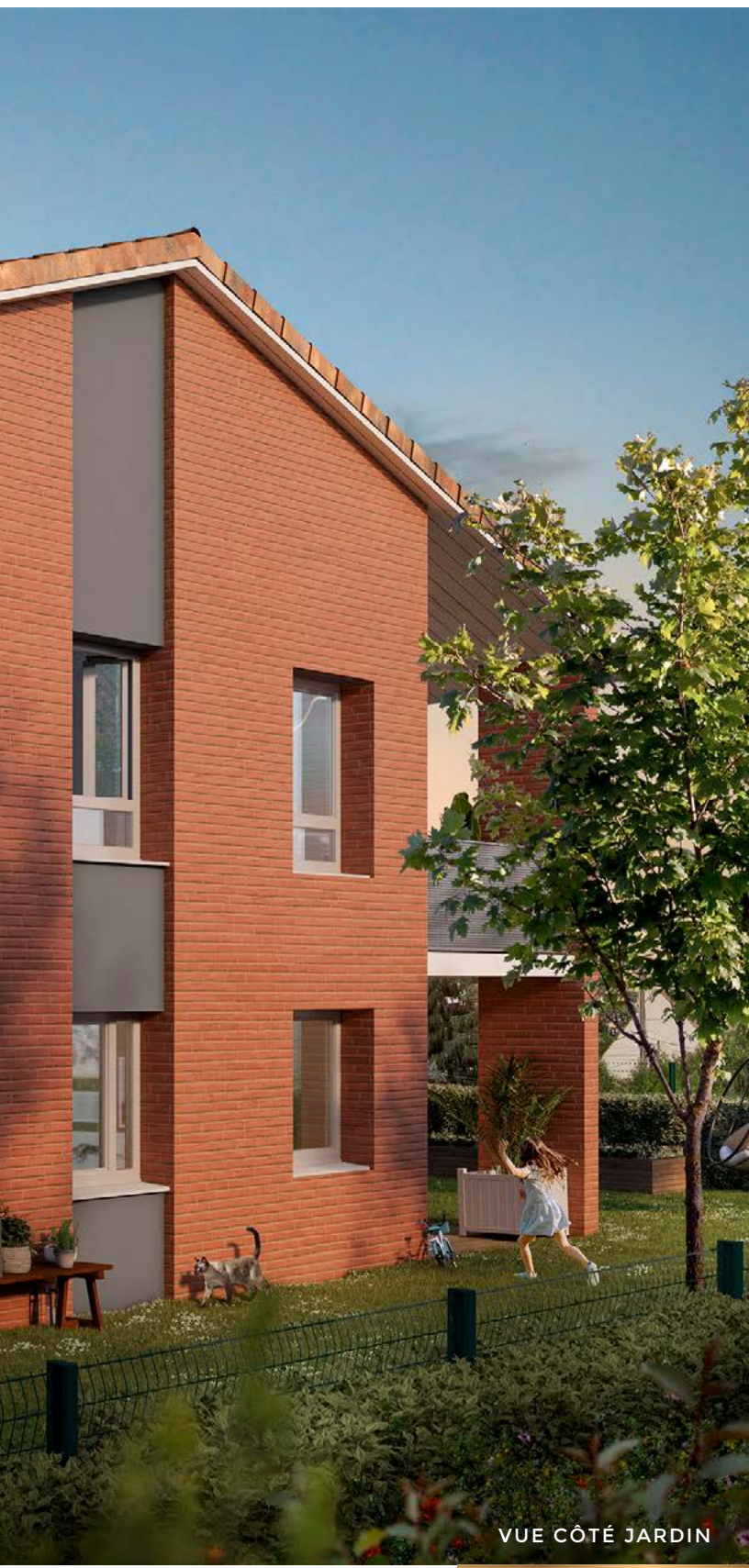
VUE CÔTÉ JARDIN