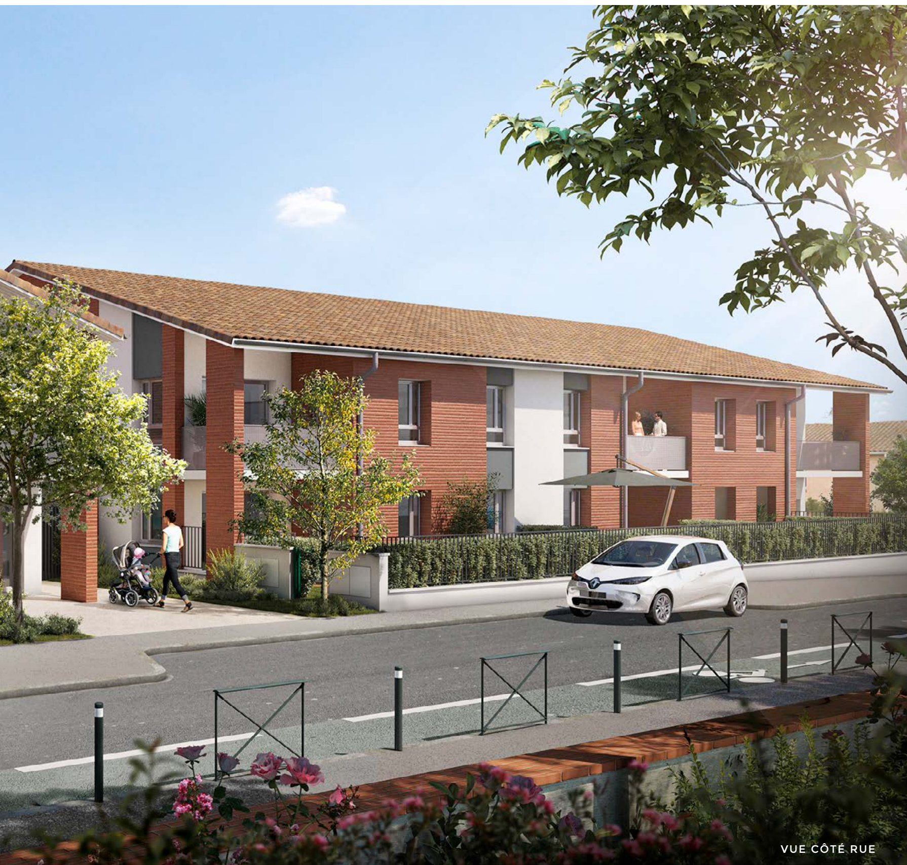
VUE CÔTÉ RUE