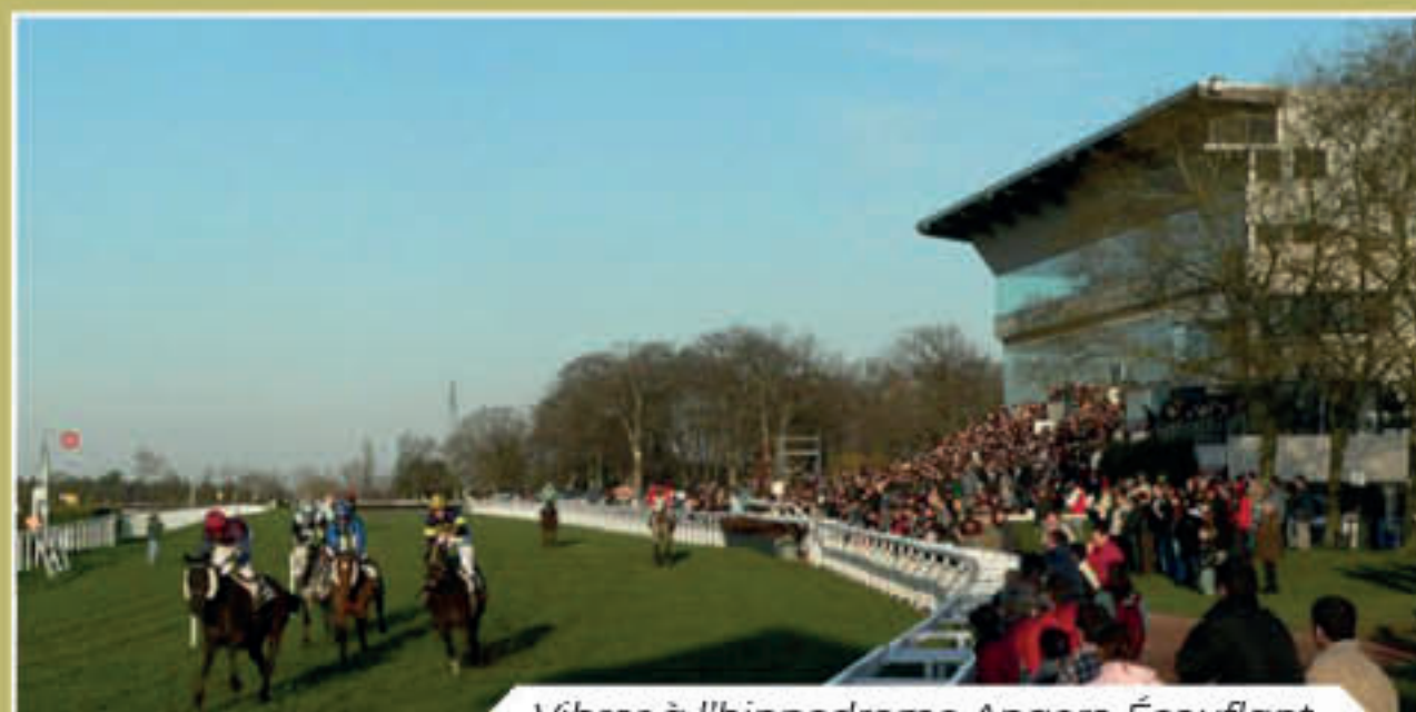
Vibrer à l'hippodrome Angers-Écouflant