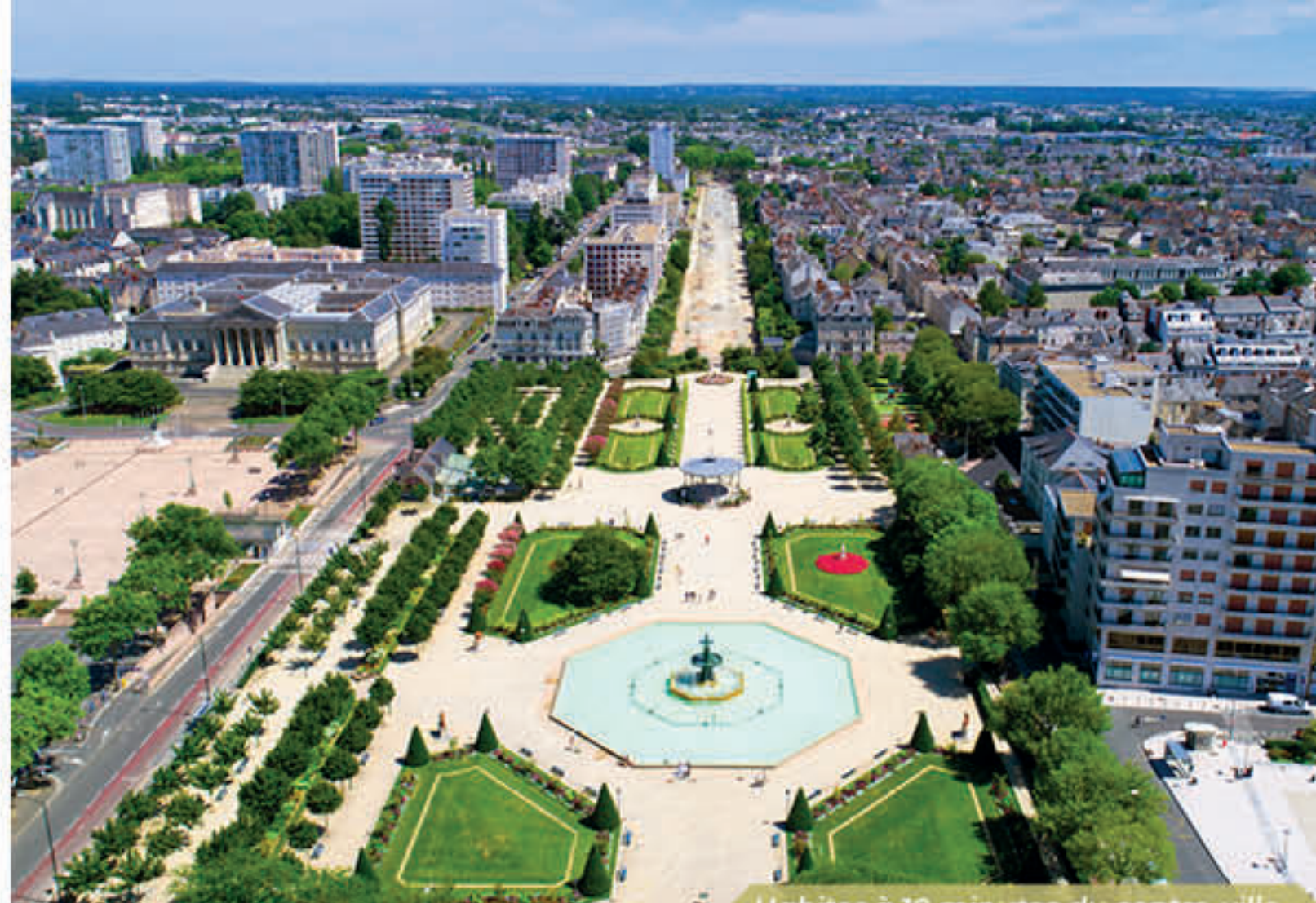
Habiter à 10 minutes du centre-ville