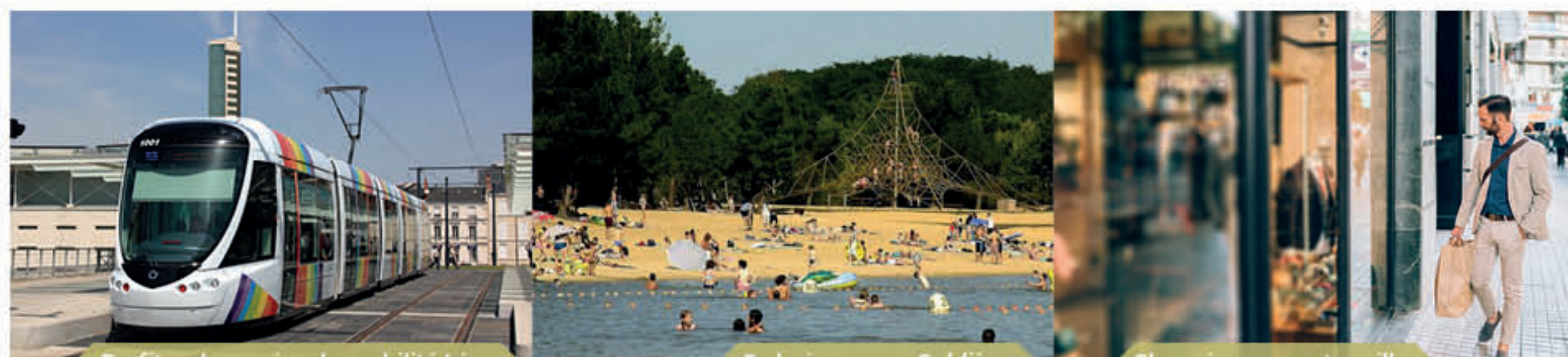
Profiter du service de mobilité Irigo

Angers est la deuxième métropole et le cœur géographique des Pays de la Loire. Avec ses 302 000 habitants, l'agglomération dispose de tous les équipements des grandes villes en termes de santé, de culture, de sports et de loisirs. Très vivante et à taille humaine, cette capitale régionale est très largement reconnue pour sa qualité de vie – « la ville où il fait bon vivre » – et sa dynamique de croissance importante.