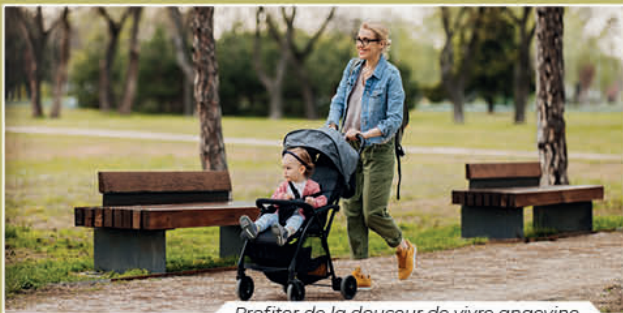
Profiter de la douceur de vivre angevine