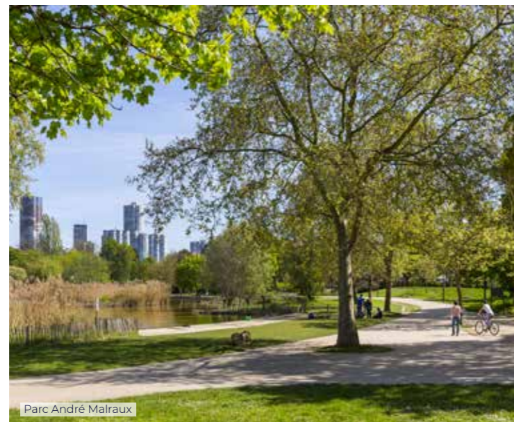
Parc André Malraux

La ville veille quotidiennement à la propreté des espaces publics ainsi qu'au bien-être des habitants.